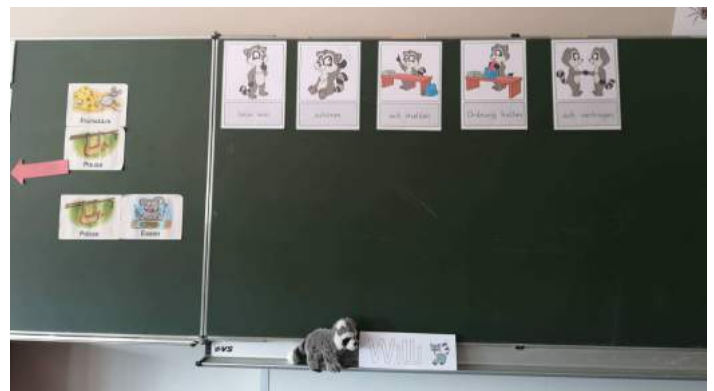
Bei den Waschbären in der Klasse 1c