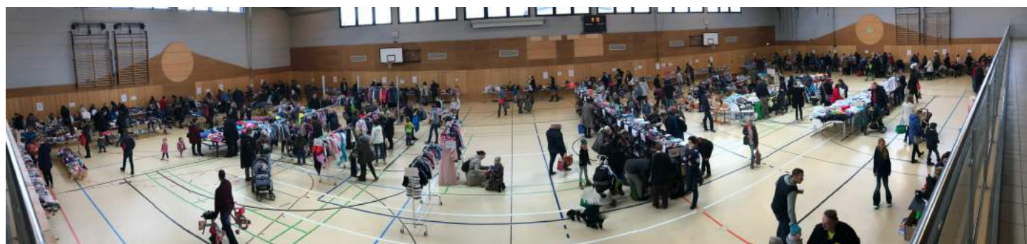
Gemeinnütziger Verein zur Förderung der Paul-Maar-Grundschule in Großziethen gegründet 2000 • Karl-Marx-Str. 142 • 12529 Schönefeld - Großziethen