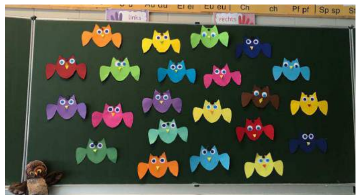
Bei den Eulen in der Klasse 1b