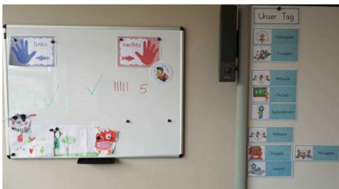
Bei den Seepferdchen in der Klasse 1d