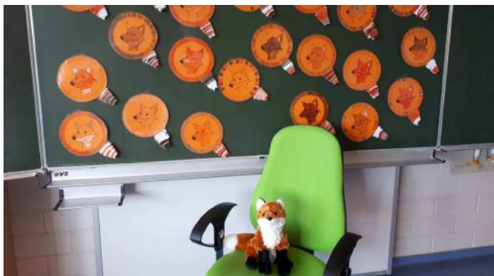
Bei den Füchsen in der Klasse 1a